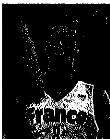
Yannick Souvré Marraine du Prix FNMI Ancienne capitaine de l'équipe de France de basket ball féminin